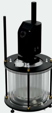
Biofilm Annular Reactor