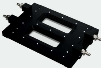
Transmission Flow Cell