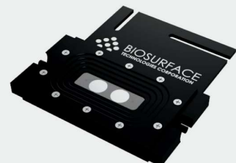
Coupon Evaluation Flow Cell