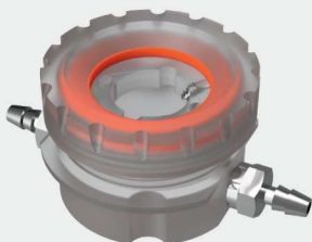
Treatment Imaging Flow Cell